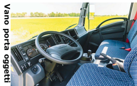
Vano porta oggetti